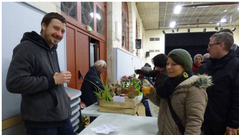
Ambiance festive pour la Fête des racines, à l'Amap.